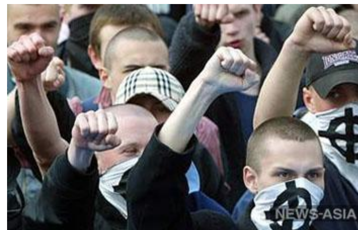
В Костроме скинхеды напали на неформалов