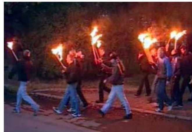
Скинхеды. Факельное шествие в Петербурге.